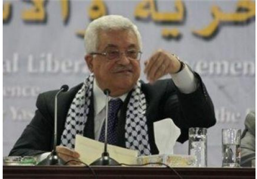
رام الله-شبكة راية الاعلامية

الإثنين 2013/05/13 - 03:45 مساءً 0 0 Google +0 0